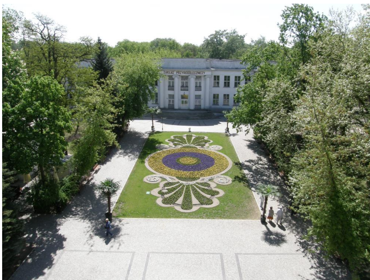
Rysunek 17. Solanki.