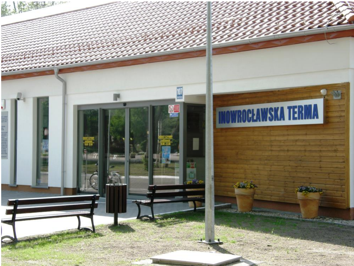
Rysunek 14. Inowrocławska Terma.

Kwestie społeczne powinny obejmować działania na rzecz aktywizacji środowisk młodzieżowych, kobiet, osób 50+, niepełnosprawnych, zagrożonych wykluczeniem. Kwestie gospodarcze mogą dotyczyć wsparcia przedsiębiorczości i samozatrudnienia, wspierania gospodarki społecznej, podejmowania lokalnych inicjatyw na rzecz zatrudnienia oraz wspierania mobilności pracowników. W zakresie rewitalizacji środowiskowej interwencje będą dedykowane rekultywacji terenów zanieczyszczonych lub zdegradowanych, mających na celu stworzenie warunków do ich ponownego zagospodarowania. Natomiast w zakres rewitalizacji fizycznej wchodzić będą zadania dotyczące odnowy części wspólnych wielorodzinnych budynków mieszkalnych, i adaptacji zdegradowanych obiektów. Działania rewitalizacyjne muszą być powiązane z poprawą efektywności energetycznej budynków.