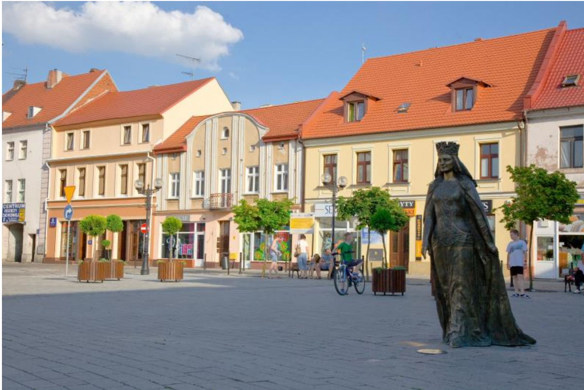
Rysunek 5. Rewitalizacja miasta.