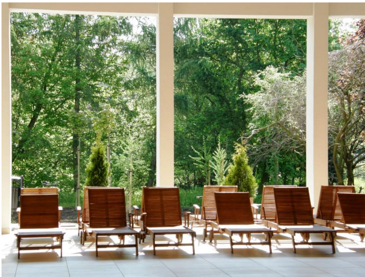
Rysunek 3. Pijalnia wód.

Miasto dysponuje potencjałem zasobów środowiska przyrodniczego i kulturowego możliwym do wykorzystania przy wprowadzeniu różnego rodzaju form rekreacji. Na terenie miasta do najciekawszych, pod względem rekreacyjnym, terenów należy zlokalizowany w południowo - zachodniej części miasta Park Solankowy, gdzie usytuowane jest Inowrocławskie Uzdrawisko oraz sanatoria, jak również muszla koncertowa, a także wiele pomników.