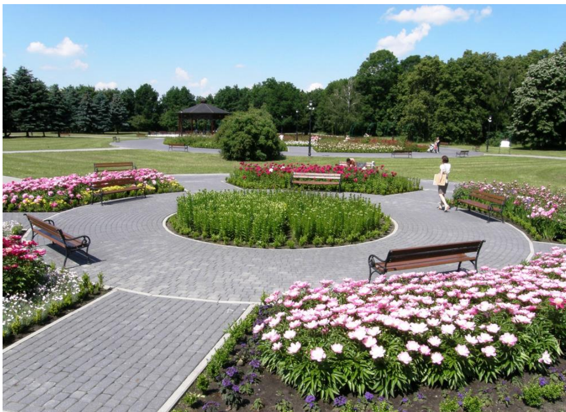
Rysunek 1. Ogrody zapachowe.

Jednym z najważniejszych założeń nowo projektowanej polityki spójności na lata 2014-2020 jest szerokie uwzględnienie w jej ramach wymiaru terytorialnego. Wynika to bezpośrednio z zapisów Traktatu Lizbońskiego , który zrównał wymiar terytorialny z wymiarem gospodarczym i społecznym. Podejście terytorialne, które powinno być jedną z podstawowych zasad programowania na lata 2014-2020, oznacza odejście od postrzegania obszarów przez pryzmat granic administracyjnych na rzecz definiowania ich na podstawie potencjałów i barier rozwoju poszczególnych terytoriów (różnej wielkości). Zintegrowane podejście terytorialne stanowi również jedną z podstawowych zasad strategicznych dokumentów krajowych: Koncepcji Przestrzennego Zagospodarowania Kraju 2030 (KPZK) oraz Krajowej Strategii Rozwoju Regionalnego 2010-2020 (KSRR) a także Umowy Partnerstwa , która stanowi podstawę realizacji dla działań wspieranych ze środków Wspólnych Ram Strategicznych (WRS), w tym w szczególności z funduszy strukturalnych w Polsce. 1