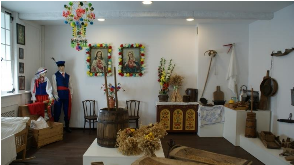
Rysunek 13. Centrum Dziedzictwa Kujaw Zachodnich.

Inowrocław stanowi ważny ośrodek uzdrowiskowy i turystyczno-rekreacyjny. W mieście zlokalizowany jest zespół uzdrowiskowo-wypoczynkowy odwiedzany przez kuracjuszy z całej Polski i z zagranicy. Baza sanatoryjna w Inowrocławiu to nowoczesne placówki z szeroką bazą zabiegową. W ciągu roku w obiektach uzdrowiskowych leczy się i rehabilituje w zakresie kardiologii, reumatologii i schorzeń układu ruchu oraz gastrologii ok. 34 tysięcy kuracjuszy. W najbliższych latach prognozowany jest wzrost liczby odbiorców usług uzdrowiskowych, dlatego należy rozwijać zakłady lecznictwa uzdrowiskowego, bazę noclegową (w tym również na terenie gminy) i sanatoryjną. W związku z projektowaną zmianą finansowania lecznictwa uzdrowiskowego 8 wzrost kosztów leczenia w uzdrowiskach może wpłynąć negatywnie na popyt na rynku turystyki uzdrowiskowej.