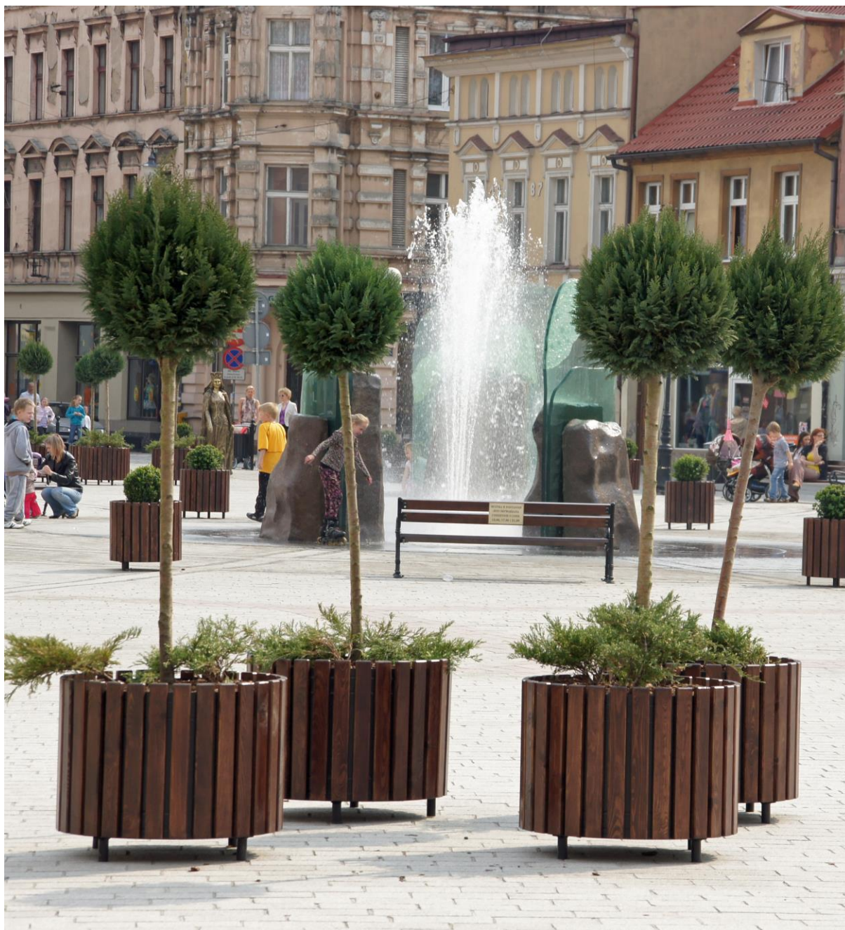
Rysunek 15. Fontanna multimedialna.