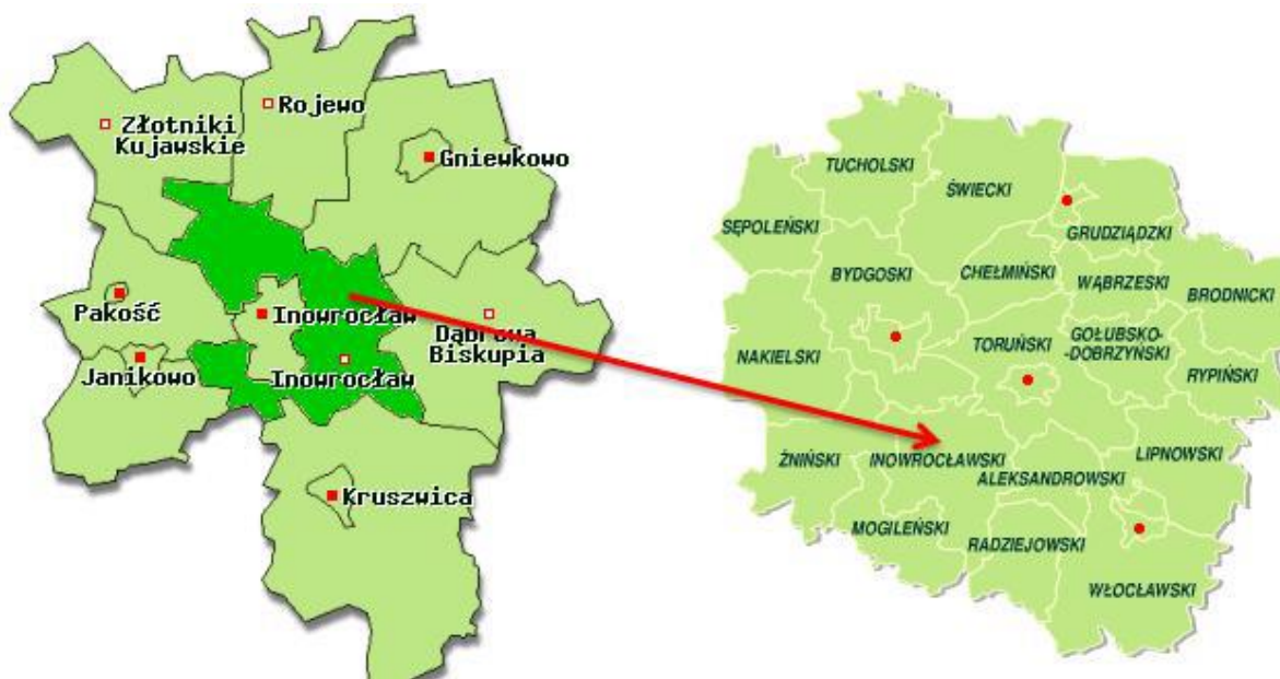
Rysunek 2. Położenie gminy Inowrocław na tle powiatu inowrocławskiego i województwa.