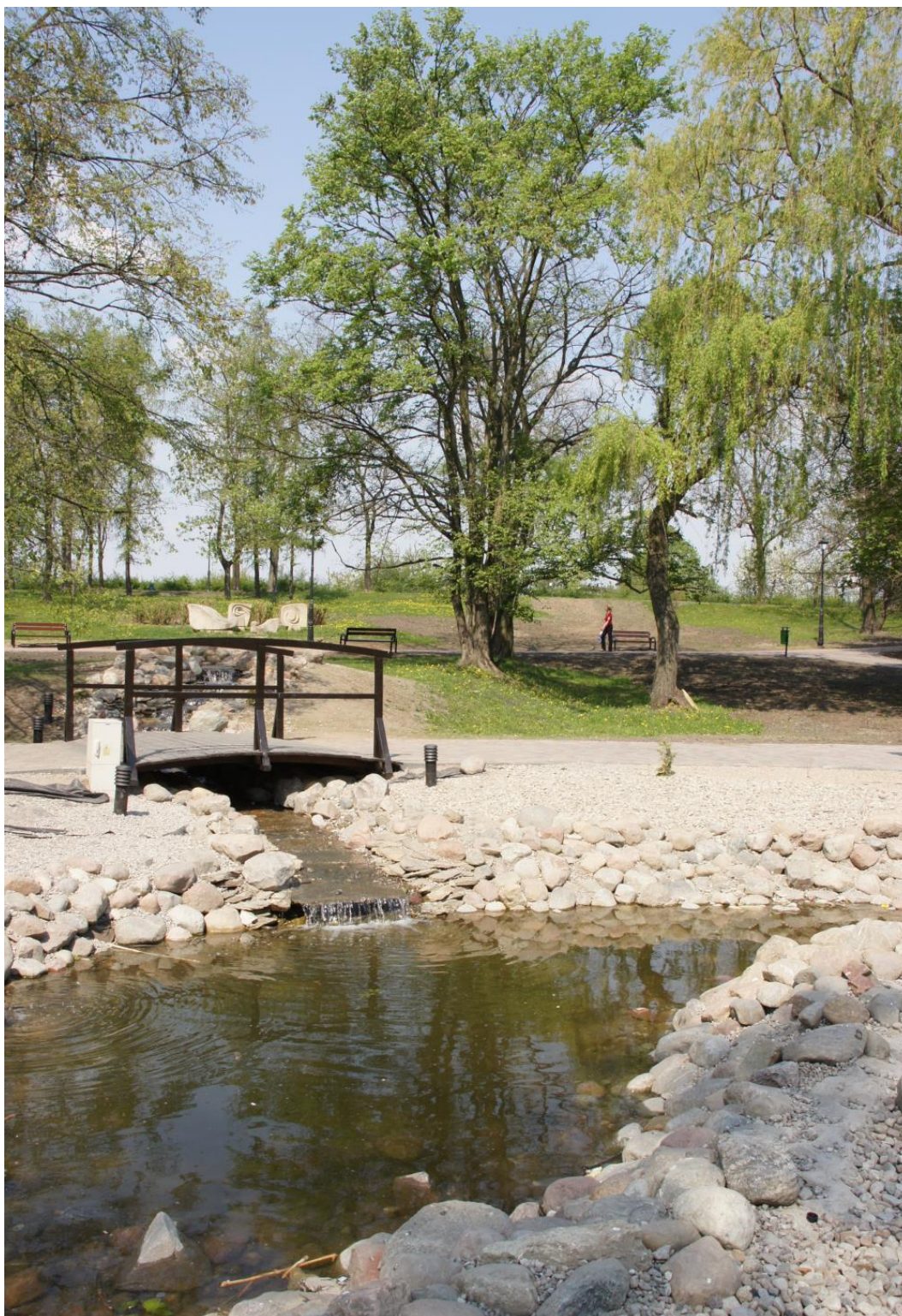
Rysunek 16. Skwer Wyczółkowskiego.