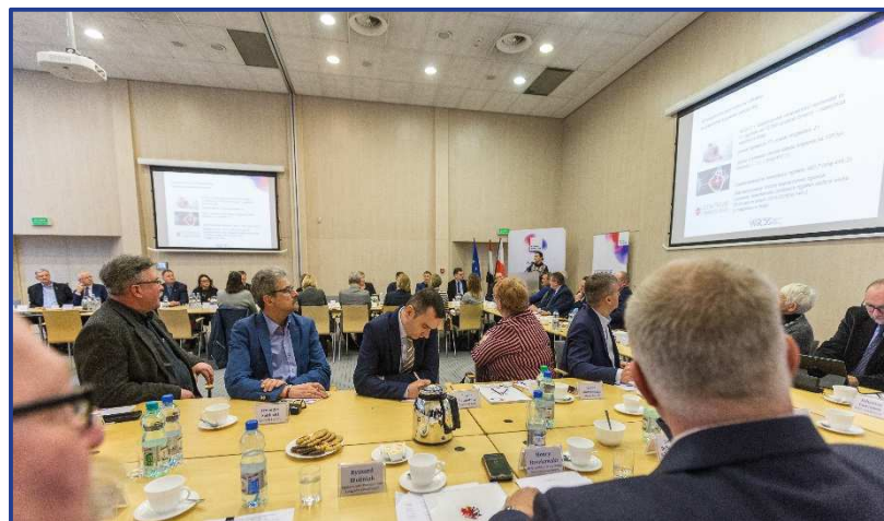
Kujawsko-Pomorska Wojewódzka Rada Dialogu Społecznego/Urząd Marszałkowski Województwa Kujawsko-Pomorskiego w Toruniu

Do 4 grudnia jest głosowanie nad przyjęciem stanowiska.