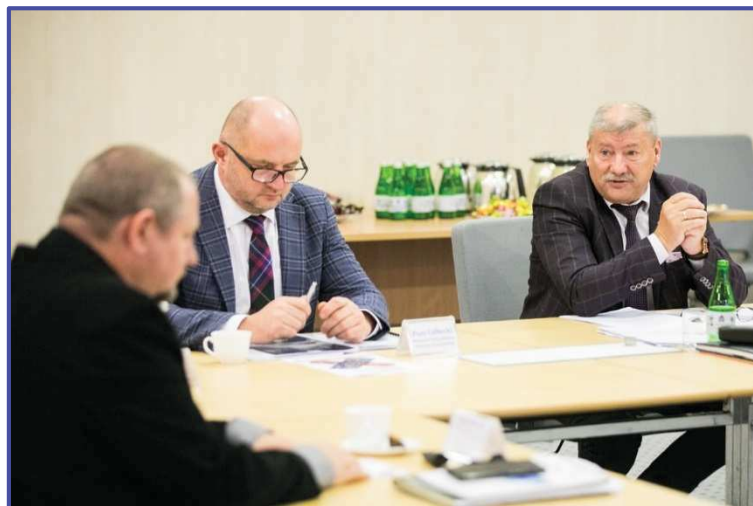
Kujawsko-Pomorska Wojewódzka Rada Dialogu Społecznego/Urząd Marszałkowski Województwa Kujawsko-Pomorskiego w Toruniu