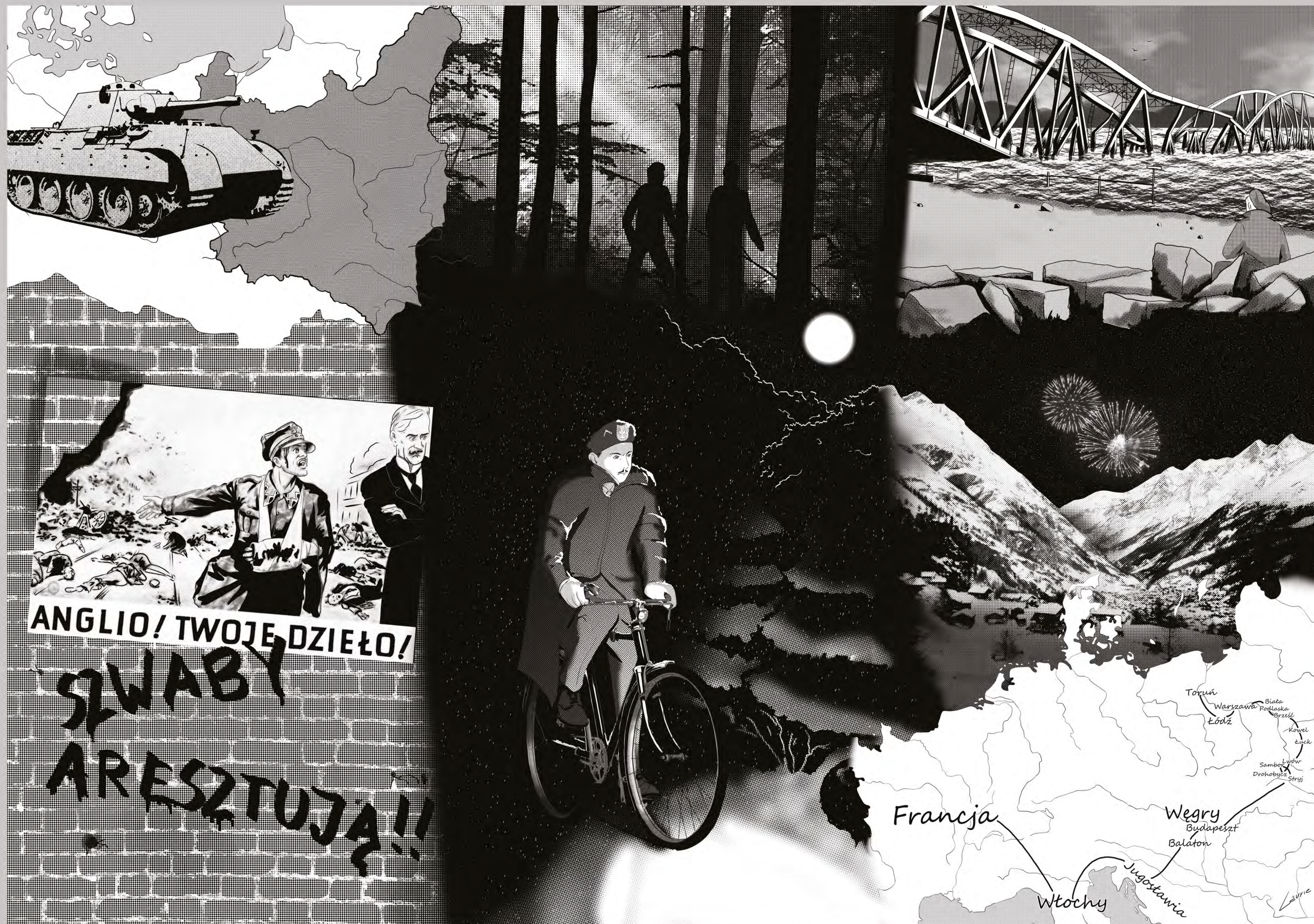
Po wybuchu II Wojny Światowej brał udział w kampanii wrześniowej, w bitwie nad Bzurą. Po klęsce wojsk polskich uniknął niemieckiej niewoli i wrócił do Torunia. Aby uniknąć aresztowania przez wojska niemieckie uciekł z Polski, przez Węgry, do Francji.