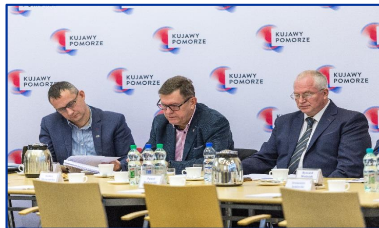
Kujawsko-Pomorska Wojewódzka Rada Dialogu Społecznego/Urząd Marszałkowski Województwa Kujawsko-Pomorskiego w Toruniu