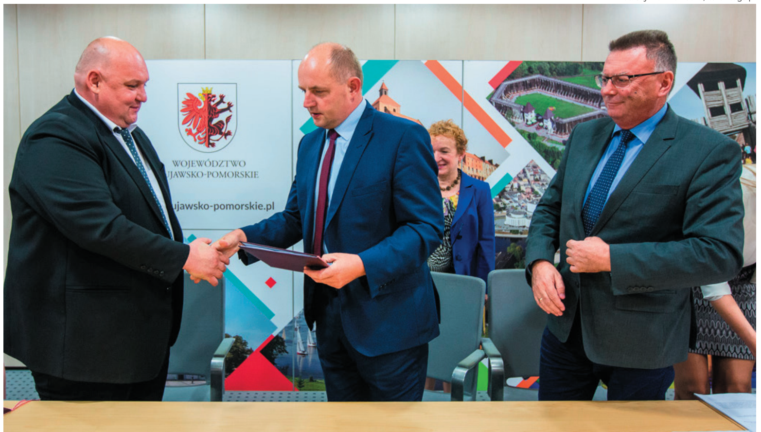
UROCZYSTE PODPISANIE UMOWY NA MODERNIZACJĘ OŚRODKA BRAILLE'A ODBYŁO SIĘ 3 SIERPNIĄ 2017 ROKU W TORUNIU

Dzięki marszałkowskiemu wsparciu uczniowie Ośrodka Braille'a mogą już korzystać z dwóch nowych i dwunastu zmodernizowanych pracowni praktycznej nauki zawodu. Inwestycja podniosła jakość kształcenia młodzieży niewidomej, słabo widzącej, głuchoniewidomej oraz z niepełnosprawnościami sprzężonymi.