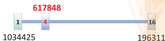
Powierzchnia uprawy zbóż a w ha w 2016 r.