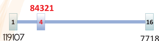
Powierzchnia uprawy rzepaku i rzepiku a w ha w 2016 r.