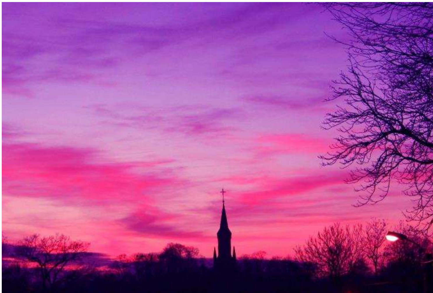
Tytuł zdjęcia „Zachód słońca nad Kościołem Ewangelickim”