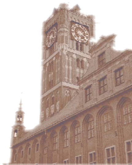
Toruń na tle innych miast wojewódzkich w 2015 r.