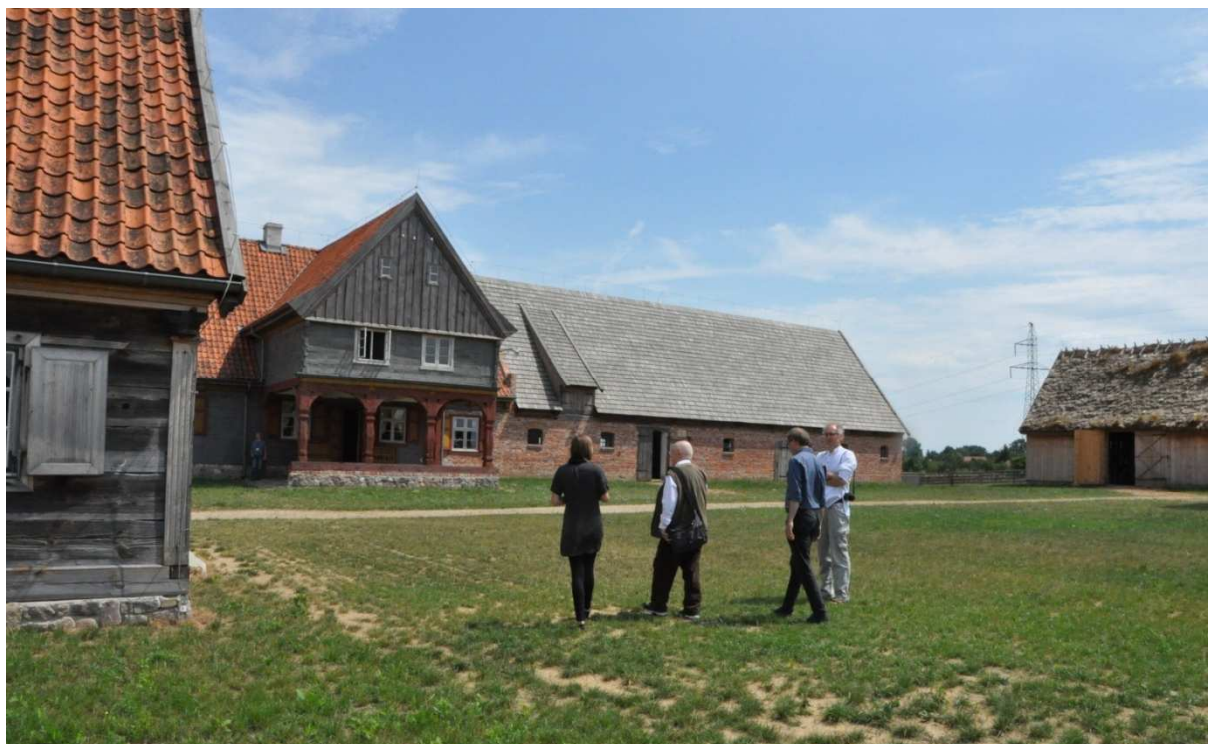
Olęderski Park Etnograficzny w Wielkiej Nieszawce