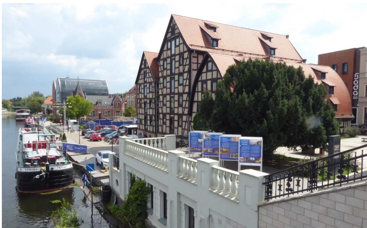
Muzeum Okręgowe im. Leona Wyczółkowskiego w Bydgoszczy