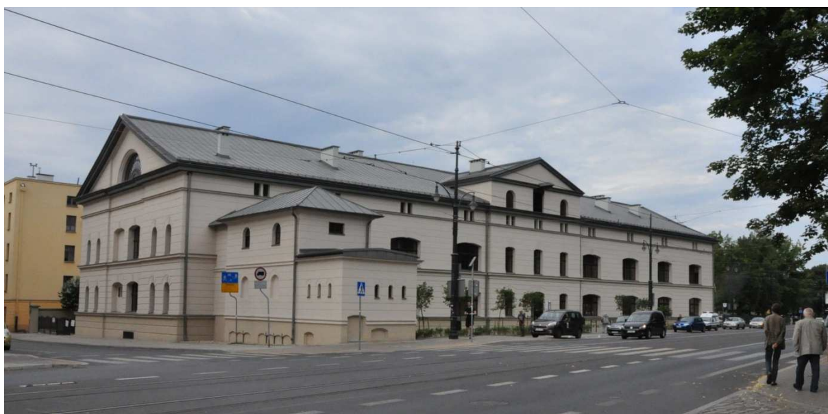
Gmach lazaretu Garnizonowego w Toruniu