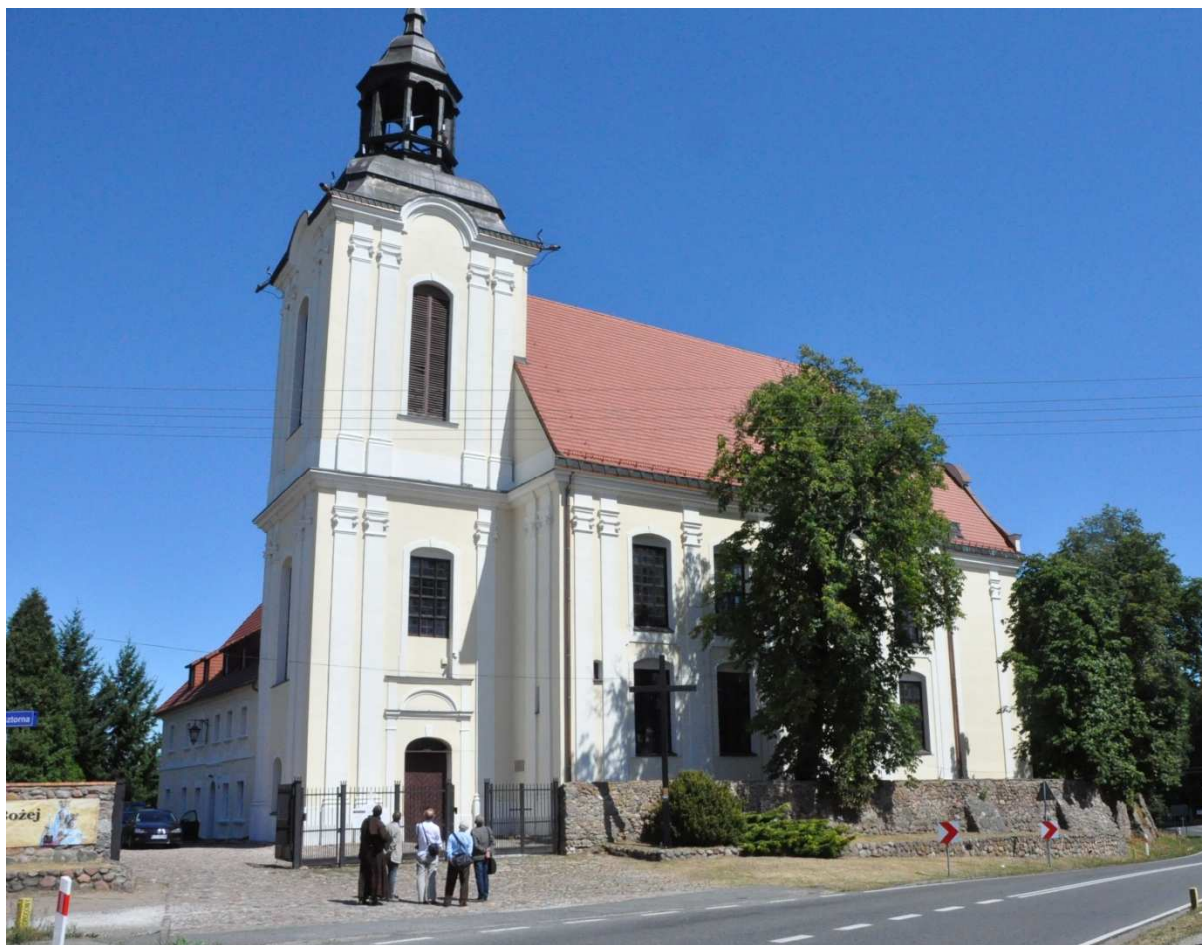
Kościół p.w. Narodzenia Najświętszej Maryi Panny w Zamartem